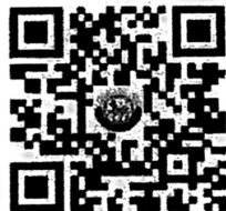
บันทึกเทป